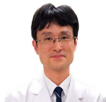
県立医科大学附属病院 笠原病院教授 (感染症センター長)

そのため、この3つを適切な方法で遮断することにより、感染を防止することができます。