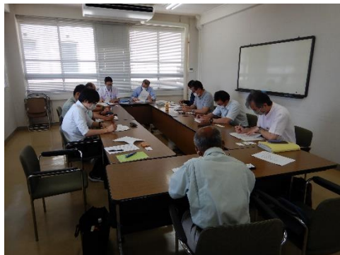
（市町村個別相談会）