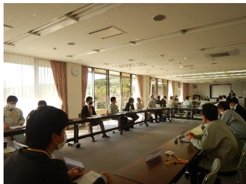
（市町村担当者情報交換会）