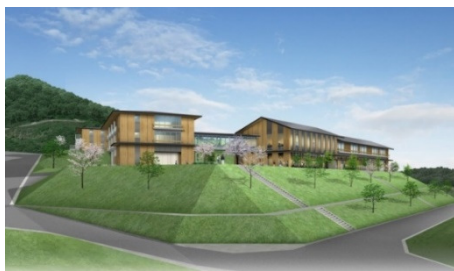
セミナーハウス(イメージ)