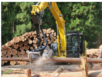
高性能林業機械による造材