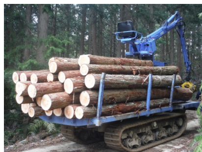
高性能林業機械による搬出