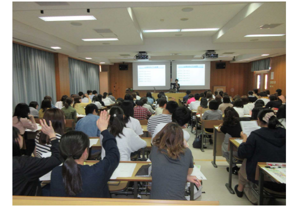
県内大学での移動講座（H30年5月） 「20歳になったらご用心！」