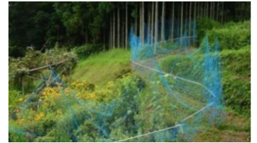
シカ・イノシシの侵入防止柵