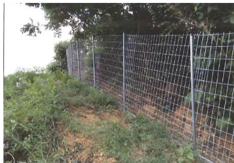
防護柵(ワイヤーメッシュ柵)