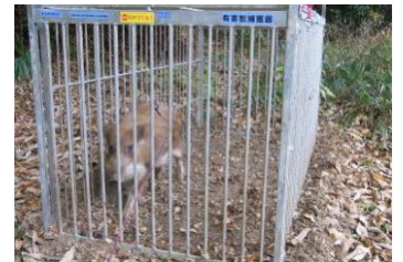
捕獲したイノシシ