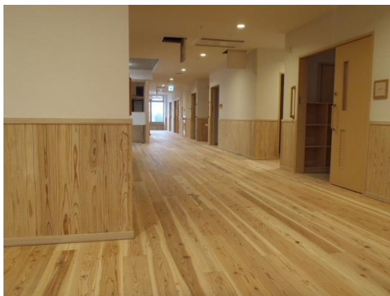
民間特別養護施設