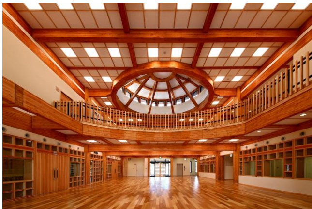
奈良県農業研究開発センター 交流サロン棟