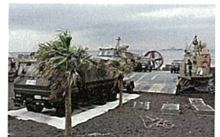
離島統合防災訓練（イメージ）