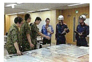
現地調整所（県庁）での連携