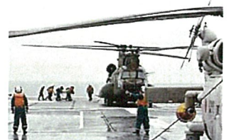
「ひゅうが」における患者搬送訓練