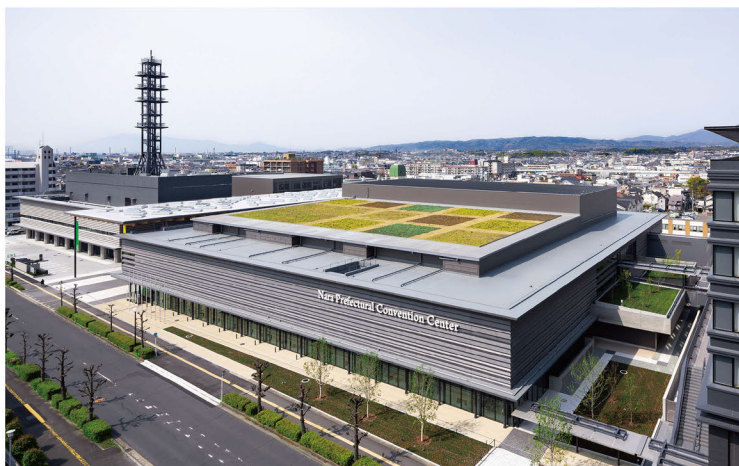
奈良県コンベンションセンター