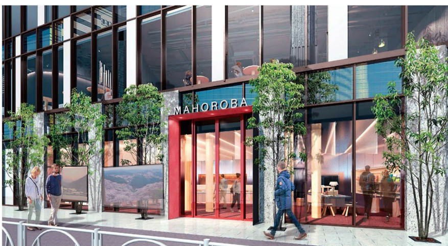
「奈良まほろば館」新拠点(イメージ)

●知事 東京新橋に、「新・奈良まほろば館」がオープンします。奈良の迫力ある景色を東京の皆