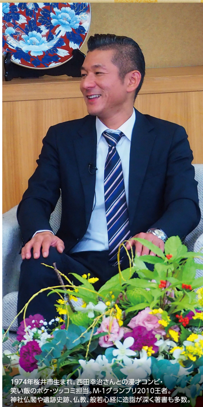
1974年桜井市生まれ。西田幸治さんとの漫才コンビ・笑い飯のポケ・ツッコミ担当。M-1グランプリ2010王者。神社仏閣や遺跡史跡、仏教、般若心経に造詣が深く著書も多数。