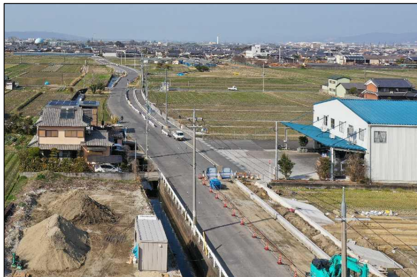
全区間完成間近（2021年）