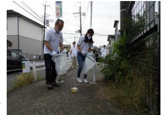
クリーンキャンペーン

日々の店舗周辺の清掃に加え、「まほろばクリーンキャンペーン」として店舗を拠点とした広範囲の地域の清掃・美化活動を毎年県内営業所の全社員で実施しており、県内各地で地域の美化に長年にわたり貢献されている。