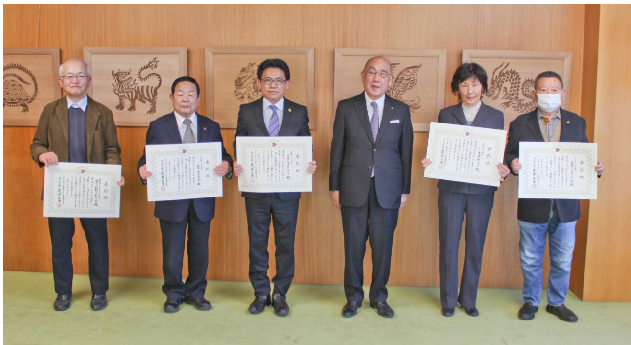
受賞された団体の皆様と知事の記念撮影

受賞団体の皆様のご活動に敬意を表しますとともに、これからもますますご活躍されることを期待しております。