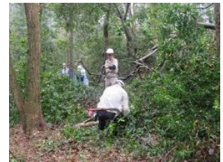
植林地の整備（生駒山麓公園）

「生駒の森を元気に！」をスローガンに、様々な里山保全活動を行っている。生駒山麓公園や矢田丘陵遊歩道を中心に、荒廃した里山や竹林の整備、遊歩道の維持を行っている。 子どもや地域の人を対象に自然に親しむイベントも開催し、地域の環境保全意識の向上にも長年にわたり貢献されている。