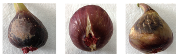
図1 ‘柘井ドーフィン’の主な障害果（規格外品） 左から傷果、裂果、汚損果

燃油にかかる経費を試算すると、10aあたり約154万円（税別）であるのに対して、低コスト型加温栽培では約70万円（税別、重油に換算）であり、経費を約55%削減できます。