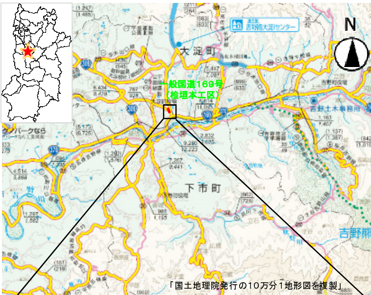
「国土地理院発行の10万分1地形図を複製」