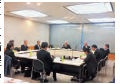
土地利用に関する懇談会

答 県の用途別土地利用の現状は住宅系が大半で、工業系・商業系が少なく、経済の自立、とりわけ多様な雇用の創出に資する土地利用の推進が重要な課題である。そこで今後の土地利用のあり方を検討するため、有識者による懇談会を設置して議論を進めるとともに、市町村長や地域の方々からもご意見を頂いているところ。引き続き、都市・農地・森林等のあり方やそれぞれの調和と共生について議論を深め、今後のまちづくりに繋げていくとともに、国に対して、県の実情を踏まえた政策提案を積極的に行っていく。