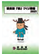
奈良新「都」づくり戦略2021

県内の行政資源を総動員し、予算案に計上した施策に積極果敢に取り組んでまいりたい。