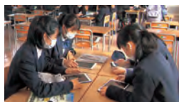
国際高校での端末の活用の様子

1人1台での活用が既に始まっている県立国際高校では、これを用いてプレゼンテーションが行われているほか、板書や資料配付時間の短縮により、議論等授業の充実ができています。令和4年3月末までには、全ての県立学校で生徒の私有端末を基本とした1人1台の環境を整え、ICTを活用した教育が行えるように取り組む。