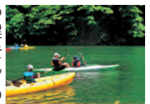
おおたき龍神湖のカヌーイベント

答 国民スポーツ大会・全国障害者スポーツ大会の競技は、市町村と連携し、県内全域で実施したいと考えている。南部・東部地域では、既に豊かな自然や地勢など地域の魅力を活かした様々なスポーツイベントが定着し、賑わいづくりに繋がっていることから、これまでの取組も参考に競技会場を選定したい。また、南部・東部地域における住民のスポーツや健康づくりへの関心を高めるとともに、トップアスリートの育成も考えていきたい。