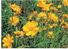
オオキンケイギク(特定外来生物)