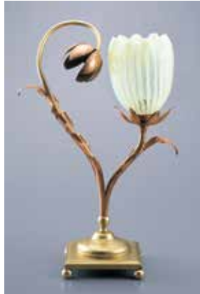
《卓上ランプ》20世紀初頭 デザイン:ウィリアム・アーサー・スミス・ベンソン ランプシェード:ジェームズ・パウエル