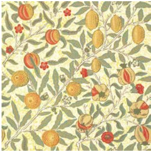
《柘榴あるいは果実》1866年頃 デザイン:ウィリアム・モリス