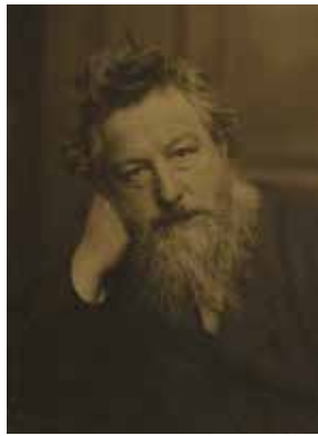
ウィリアム・モリスの肖像写真 1886年頃

モダン・デザインの父と称される 才人ウィリアム・モリス。 その生涯と軌跡をたどる。