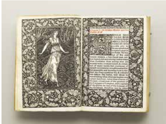
ウィリアム・モリス『世界のかなたの森』1894年 ケルムスコット・プレス