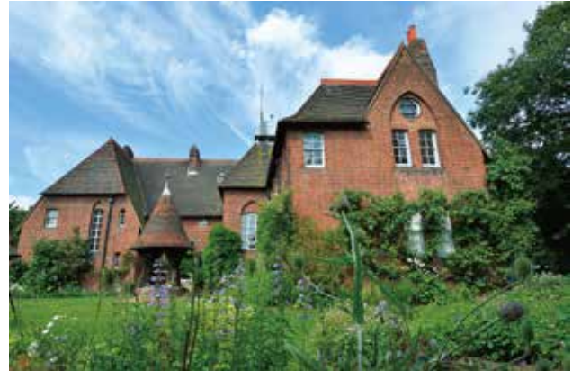
織作峰子 写真《赤煉瓦の館》 Thanks to the National Trust Red House, Bexley, London

モダン・デザインの父と称される 才人ウィリアム・モリス。 その生涯と軌跡をたどる。