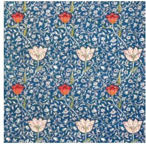
《メドウェイ》1885年 デザイン:ウィリアム・モリス