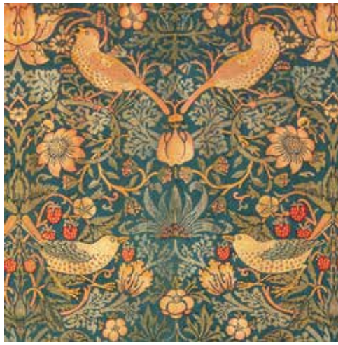
《いちご泥棒》1883年 デザイン:ウィリアム・モリス