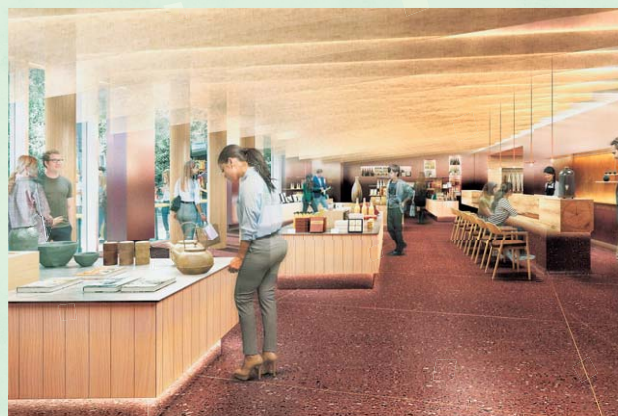
物販スペース ※イラストはイメージです。