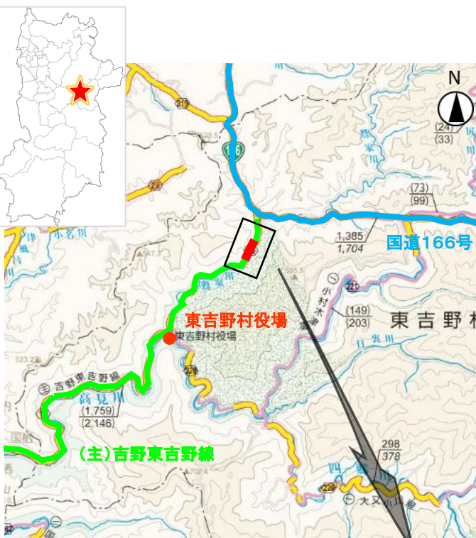
「国土地理院発行の10万分1地形図を複製」