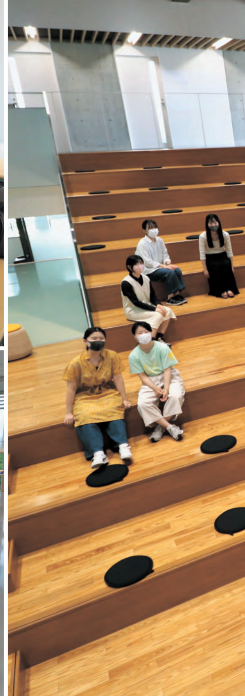
教室(コモンズ棟) ゼミや自習などで使用しています。