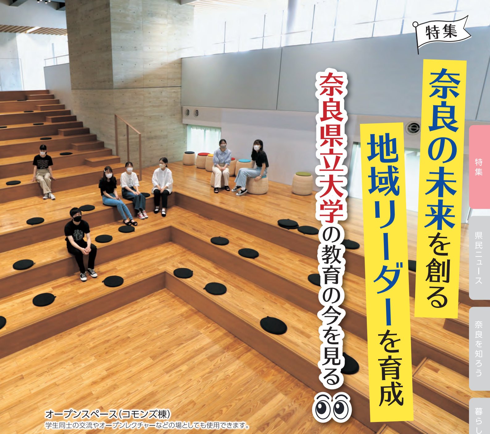
オープンスペース(コモンズ棟)