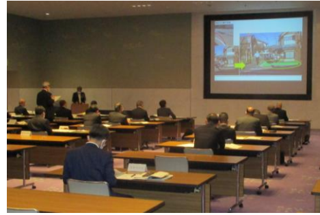
写真-2 令和3年度第1回通学路等安全対策推進会議

今後は、市町村から報告される対策案について、県、県教育委員会、警察本部が第三者視点で対策検討案の内容を再度確認し、改善の必要のある対策について、市町村に提案を行う予定である。そして、1月下旬に開催予定の令和3年度第2回通学路安全対策推進会議で、市町村の当面の対策案の了承と改善状況についての情報共有を行い、その対策案にしたがって、市町村教育委員会、学校、道路管理者および地元警察署が対策を継続的に実施していく予定である。(図-2)