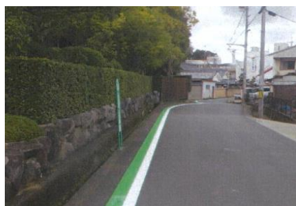
写真-4 路側帯のカラー舗装