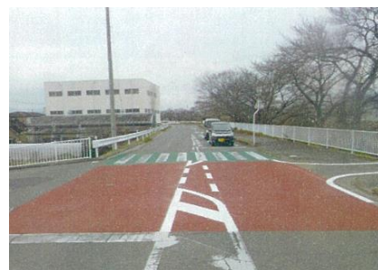
写真-6 交差点のカラー舗装