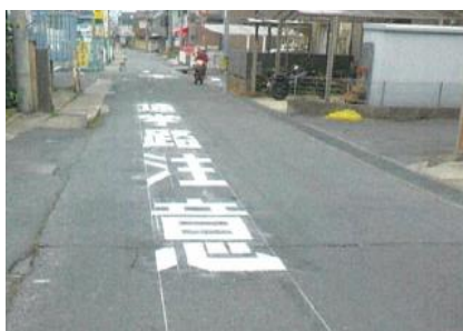
写真-5 路面標示の設置