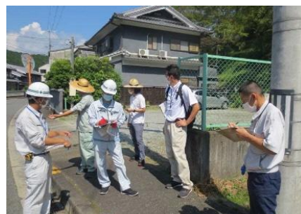
写真-1 大和高田市、下市町における合同点検の様子