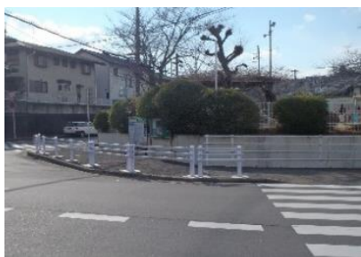
写真-3 防護柵の設置

こういった県全体の動きのなかで、道路関係機関でも、市町村教育委員会から合同点検への参加要請により、国、県、市町村の道路管理者が合同点検を行っている。奈良県道路保全課では、今後、市町村から報告される対策案について、「危険箇所において道路管理者の対策メニューがなかった場合、さらなる道路管理者の対策が実施できないか」、「用地買収が必要な歩道設置等、時間を要する対策案の場合、速やかに対策の実施が可能な防護柵の設置等ができないか」等を確認する予定である。改善策の事例としては、防護柵の設置や路側帯のカラー舗装等の歩行者の安全性が向上する対策や、路面標示の設置や交差点のカラー舗装等のドライバーに注意喚起を促す対策などが考えられる。(写真-3～6)