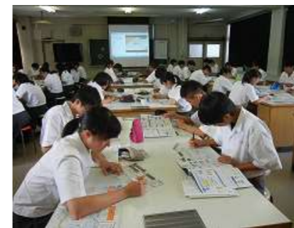
奈良県立平城高等学校における「社会への扉」を活用した授業風景(令和元年9月)

○県内の高等学校等における消費者庁作成教材「 社会への扉 」を活用した授業の促進(67校中 H30:45校実施、R1:55校実施)や、県内の学校や地域団体等に対する移動講座など、 消費者被害の未然・拡大防止のための啓発活動 を実施