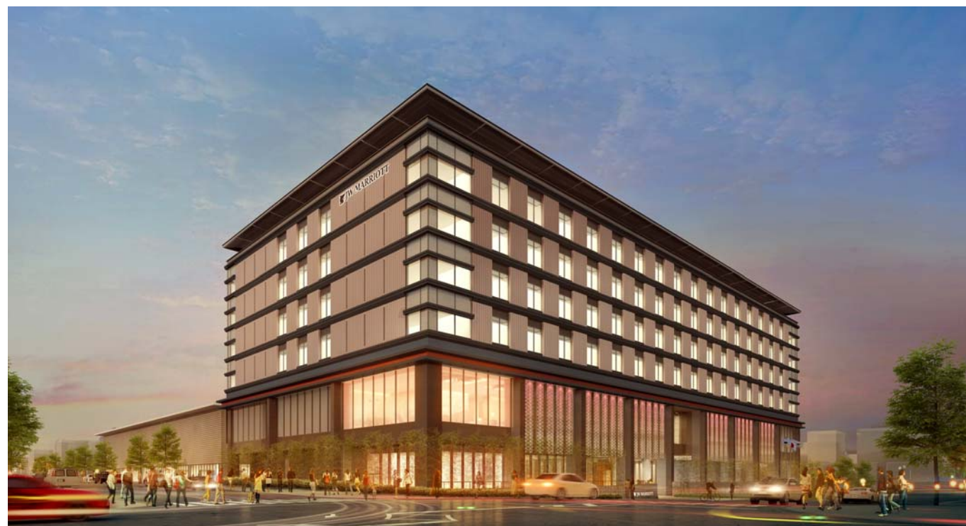
ホテル施設 大宮通り側 イメージ