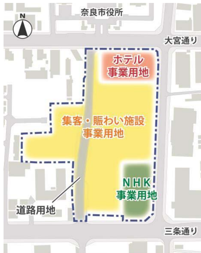
〈拠点事業内ホテル配置図〉