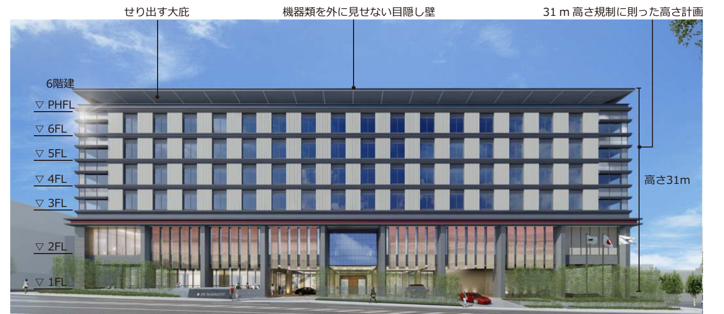
ホテル施設 大宮通り側 立面図