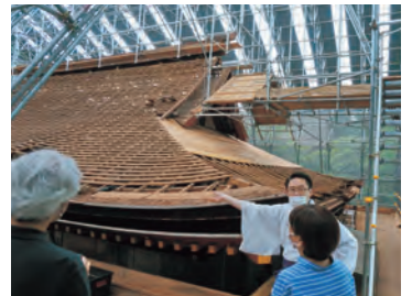
石上神宮 修理現場見学(6月より)