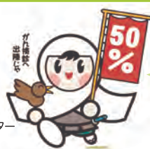
イメージキャラクター「けんしんくん」

がんは今では治る病気です。 早期発見・早期治療 することで治る確率も高くなるため、 がん検診は重要です。 定期的ながん検診を受けましょう！