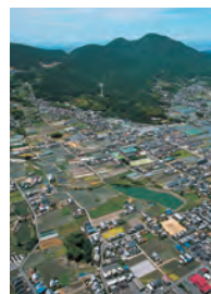
竹内街道沿線の古墳

葛城の古道を辿りながら、地域の歴史、古代の有力な豪族だった葛城氏の歴史を紹介する展示会を開催します。