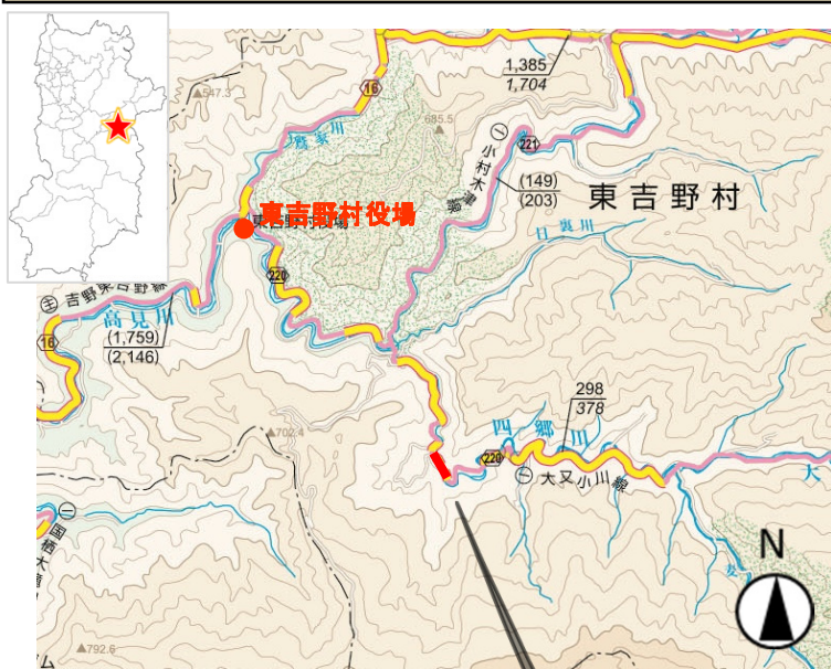
「国土地理院発行の10万分1地形図を複製」