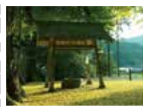
95 春日神社の ラッパイチョウ

村名は垂仁天皇の皇女、倭姫命(やまとひめのみこと)が天照大神鎮座の地を求めての旅の途中、宮の候補地として自らの杖を残したという伝承に由来する。多くの伝承から「神の御心に叶う」といわれた街道は約14kmにわたって村内を東西に通っている。