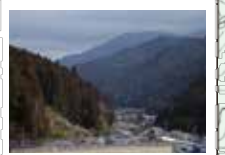
98 桜峠からの眺め 植林が切れたところから東の山々が見渡せる。小学校の建築で街道はなくなっている