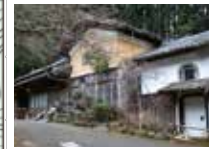
57 宮田家 玄関の上に「女人高野室生山之図」の絵馬額を掲げる