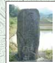
65 行悦道標② 「はせよりこれへ三里 回國供養 是より 宮川え十八里半」と自然石に刻む