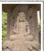
八滝から平井大師山へ 壬申の乱の際、大海人皇子(のちの天武天皇)を助け軍功をたてた文祿麻呂の墳墓が八滝集落の奥にある。高井バス停からは約4Kmで、手前の五社神社には江戸末期の石工、丹波佐吉の狛犬があり、ここから四国八十八か所霊場の石仏群がある平井大師山までは徒歩約1時間