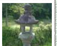
55 太神宮燈籠 慶応二年寅十月建立「御代官 武運長久」「五穀成就」と刻む