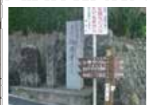
54 三基の道標 右側は仏隆寺、中央は室生寺、左側はいせみちと室生寺を指す。左の道標は100m先の分岐から移設