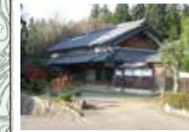
59 松本家 天明元年(1781)の建物で「御官松本重蔵」の看板が残る。「官」の字に人偏が無いのは牛馬も泊める意