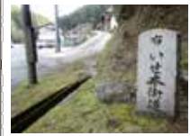
53 新しい伊勢本街道の道標 国道から坂を上がり民家前を直進して杉林に入る。擁壁の直上を通るので注意が必要