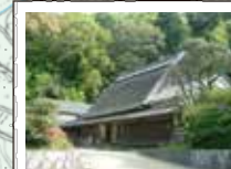
62 津越家 旧旅籠の大津屋とい立派な大和棟の旧家