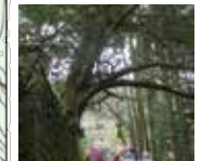
58 松本家の樞の木 元治元年(1864)まで旅籠を営んでいた松本家の石垣から突き出ており、幹に注連縄が巻かれている