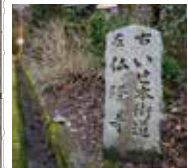
56 新しい伊勢本街道の道標 右の坂を上がり宮田家の前を通るのが旧道