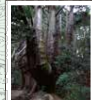
61 高井の千本杉 井戸の周りに植えられた杉が根元で癒着したもので県指定の天然記念物。根周りは35mを超える