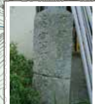
60 松本家の道標 「右伊勢道 左室生山弘法大師 是ヨリ五十丁余」天明元年(1781)のもの。1里は36丁