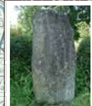
63 万葉歌碑 やまはた うた まはに 倭の宇陀の真赤土のさ 丹着かばそこもか人の 吾を言なさむ