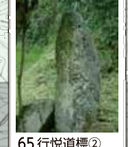
65 行悦道標② 「はせよりこれへ三里 回國供養 是より 宮川え十八里半」と自然石に刻む