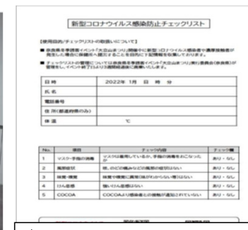
参加者全員に感染防止チェックリスト提出の徹底