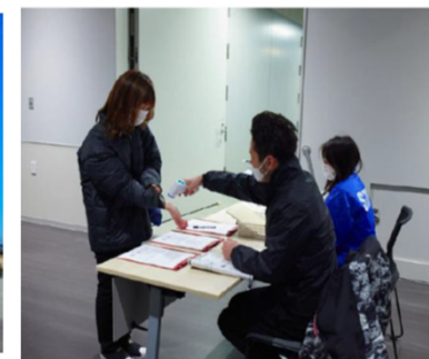
検温・適宜消毒の実施