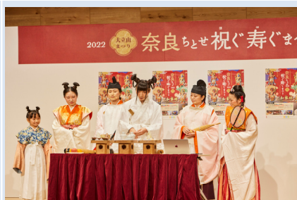
トーク・ライブショー