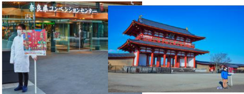
コンベンションセンター及び平城宮跡において中止案内