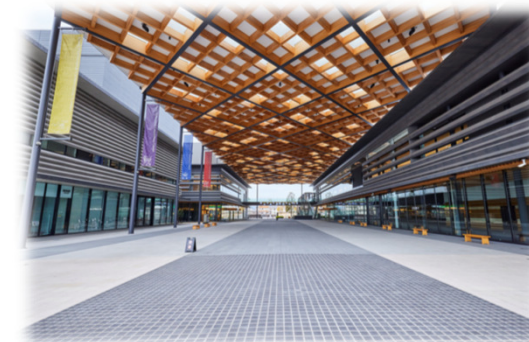
奈良県コンベンションセンターよりライブ配信