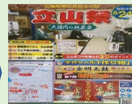
広陵町大垣内立山まつり