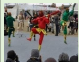
地域の伝統行催事の披露