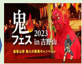
金峯山寺 鬼フェス