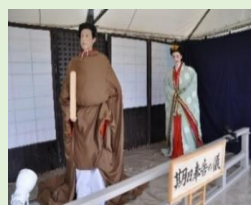
地域の立山の展示