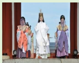
古代の正月の儀式的再現