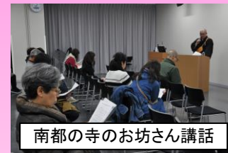
南都の寺のお坊さん講話

→平城宮いざない館内で、ワークショップを計12回、講話・トークショー・朗読を計7回行い、合計で延300名以上の方が参加。