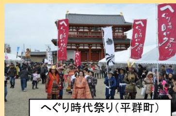
へぐり時代祭り(平群町)