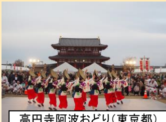
高円寺阿波おどり(東京都)