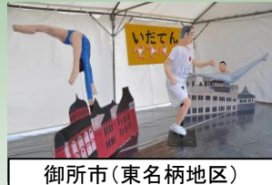
御所市(東名柄地区)