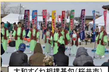
大和すくね相撲甚句(桜井市)