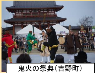
鬼火の祭典(吉野町)