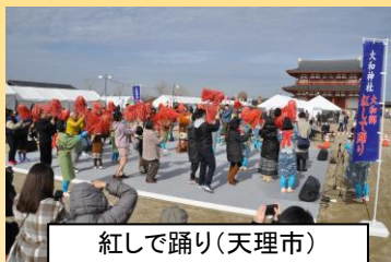
紅しで踊り(天理市)