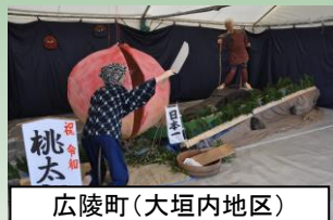
広陵町(大垣内地区)