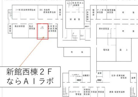
奈良県産業振興総合センター2階 平面図