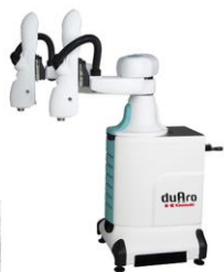
「duAro」川崎重工業製 人共存型 吸着ハンド付