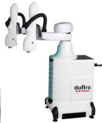
「duAro」川崎重工業製 人共存型 吸着ハンド付