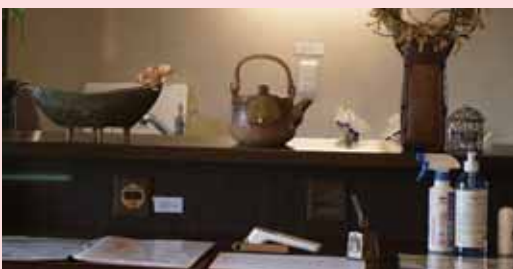
感染対策を施したカウンター

感染症対策を行うことで安心して働きやすい職場環境となり、従業員を1名新たに雇用。また、非接触のリモート受付導入によって、これまで受付に充てていた時間を子育てに充てることができた。新たな雇用や仕事と家庭を両立するための時間を生むなど派生的に良い効果も出ている。