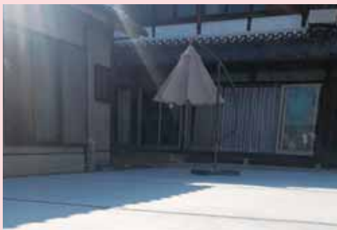
アウトドアスペース