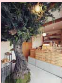
「自然との共生」「森で摘むパン屋」をイメージした店内の内装