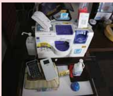
連携自動釣銭機型レジ