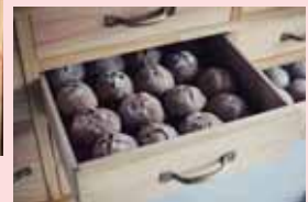
引き出し保管を利用したパンの販売