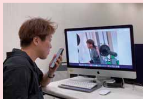
トレーニング風景

これまではトレーナーとゲストの1対1の指導方法によるパーソナルトレーニングを実践してきたが、密接・密着による感染リスクへの不安は払拭できずにいた。ゲスト、スタッフ双方が安心安全にトレーニングレッスンを行うため、非接触型ハーフパーソナルトレーニング事業を開始。半個室化と追跡型カメラ・イヤホンによるトレーニング指導システムを導入。また、十分な空間を確保するため、更衣室やモニタールームなどの配置・内装変更を行う。