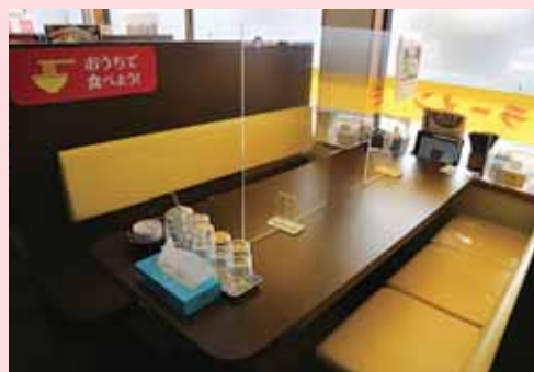
感染対策を施した店内

また、テイクアウトのオーダーをスマートフォンや PC から気軽に注文できるよう専用 WEB ページを開設し、QR コードでテイクアウト注文できるシステムを構築した。