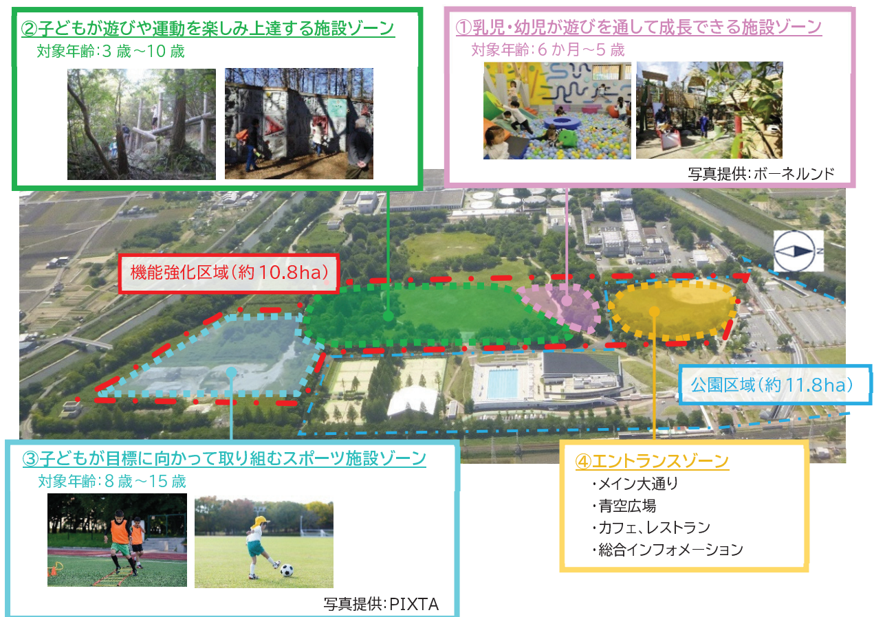
図 3.5 ゾーニング図