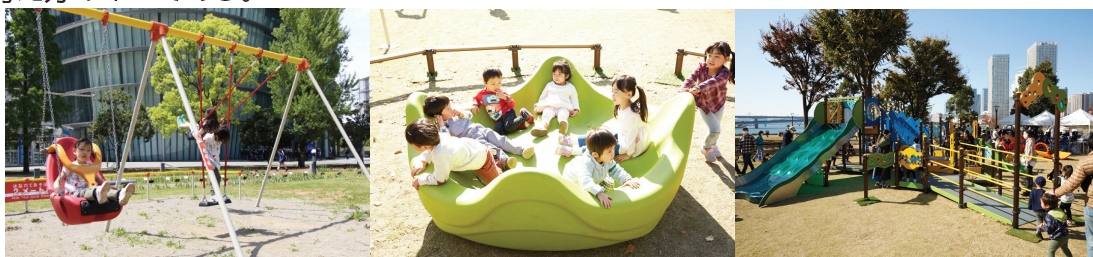
図 3.2 インクルーシブ遊具

まず「インクルーシブ」という観点については、近年公園整備においても浸透している考え方であり、「インクルーシブ遊具」や「インクルーシブ公園」と呼ばれることがある。これは、障害のあるなしに関わらず、全ての人と一緒に遊ぶことのできる空間を創ることであり、これからの公園づくりに必要な考え方の1つである。