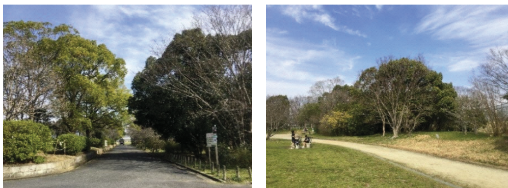
図 3.4 樹木の生育状況