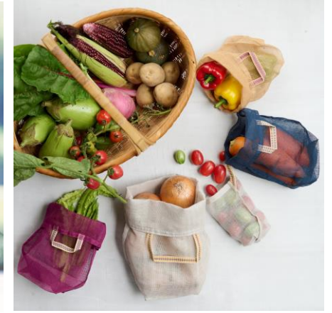
「かや大判ショール、かや野菜袋」