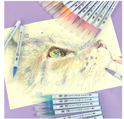
「ZIG Clean Color Real Brush (カラー筆ペン)」