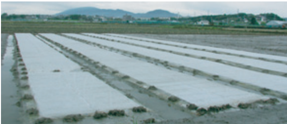
写真1 現地の育苗風景 (斑鳩町)

この育苗法は、トンネル被覆に必要な弓等が要らず、資材も安価であることから、平坦部水稲の有望な省力育苗技術であると考えます。そこで、2006、2007年に数種の被覆資材を用い、べたがけ被覆による省力育苗法について検討しました。