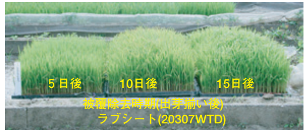
写真2 播種30日後の苗の様子

しかし、2007年は、育苗期間の気温が低く、出芽揃い15日後の被覆除去でも、草丈は目標よりもやや短くなりました(表1)。