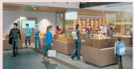
農産物直売所と伝統工芸品ショップ

県産食材を使った料理が味わえるレストランのほか、県産農産物や伝統工芸品などを販売する直売所、シャワー室を備えたサイクルステーションがあります。