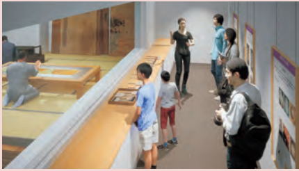
修復工房見学ルーム

※プログラムによっては事前もしくは当日予約が必要な場合があります。詳しくはHPをご確認ください。