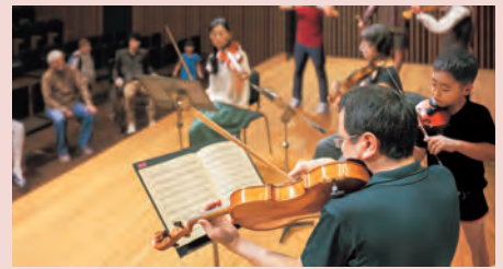
音楽・伝統芸能体験プログラム

国内外からアーティストを招き、滞在制作や来館者との交流を目的とした展示やワークショップを行います。