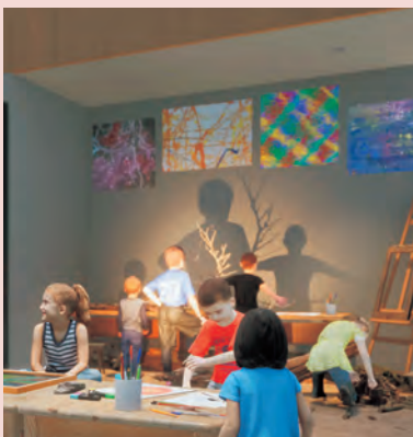
幼児向けアートプログラム

※プログラムによっては事前もしくは当日予約が必要な場合があります。詳しくはHPをご確認ください。