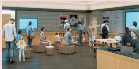
情報発信スペース

県全域の歴史文化資源や芸術などの情報に加えて、道路や観光情報も発信します。館内のトイレと授乳室は24時間利用できます。