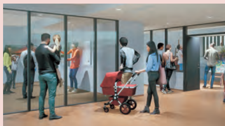
アーティスト誘致交流プログラム

「創造」と「共同」を育み、一人一人の発想と個性を尊重するプログラムを展開します。