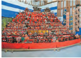
町屋の雛めぐりメイン会場

旧城下町沿いにある約50軒の町家や商店で雛人形を飾ります。壺阪寺では本尊と2,500体の雛人形の大雛曼荼羅も同時公開されます。