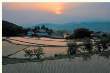
奈良県景観資産より

御所市にある菩提寺の周辺には棚田が広がり、遠くには大和三山やかすかに台高連山が望めます。田植えの頃には、田に満々と滲えられた水に光が反射する幻想的な風景が見られます。