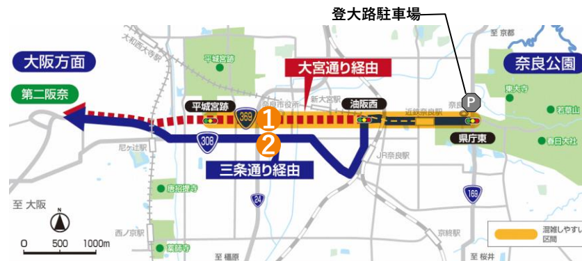
迂回誘導ルート図