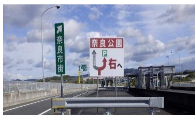
木津IC付近にP&R誘導看板を新設