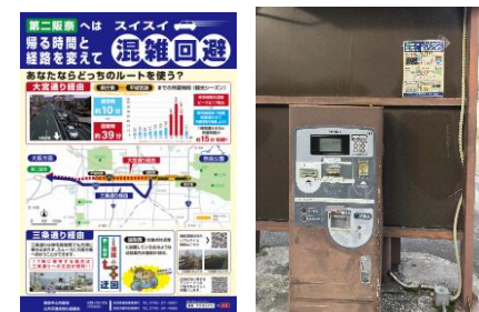
帰宅時間・経路分散チラシ・ポスター掲載状況