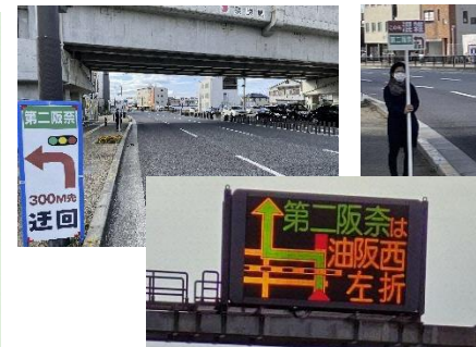
看板・プラカード等による誘導状況