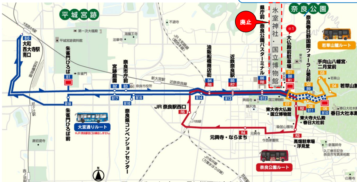
図. ぐるっとバスの運行概要(令和4年)