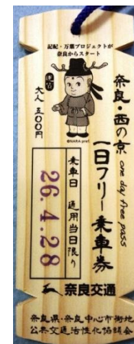
木簡型一日乗車券