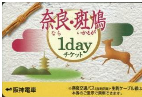
奈良・斑鳩1dayチケット