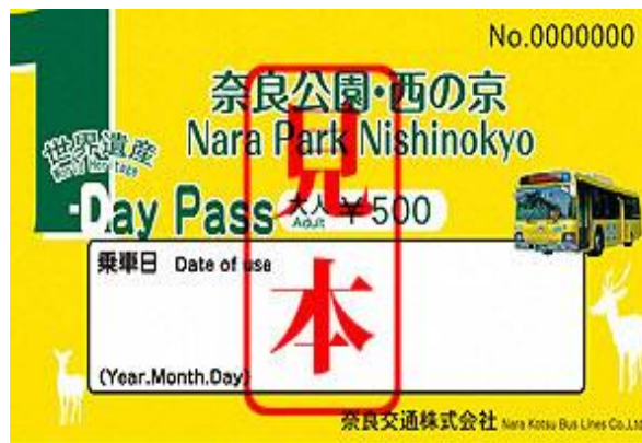
奈良公園・西の京 世界遺産1 Day Pass