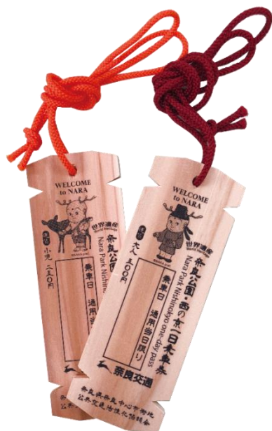
図. 木簡型一日乗車券