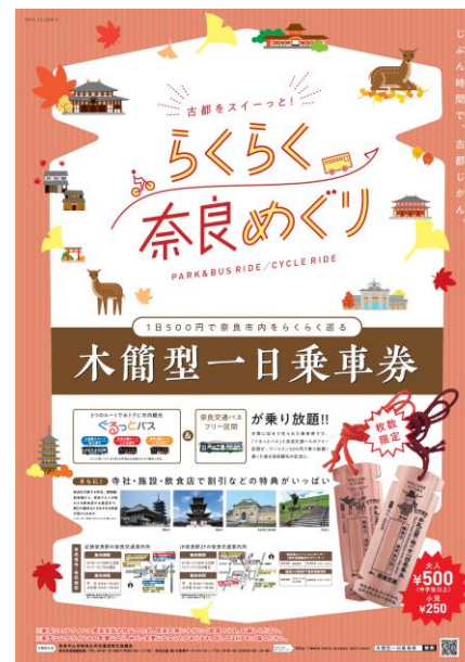
図. 木簡型一日乗車券ポスター（令和3年秋期）