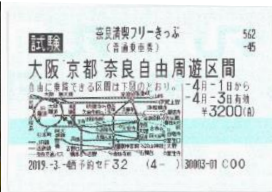
奈良満喫フリーきっぷ