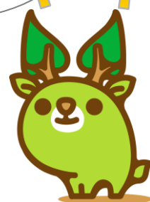
奈良県エコキャラクター 「な～らちゃん」

そんな悩みにお応えするため、県内事業所を対象に 環境の専門家をアドバイザーとして派遣します！！