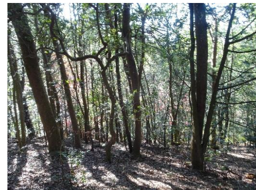
ナギ密生エリア内の様子