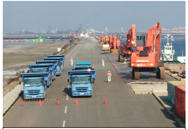
大阪湾広域臨界環境整備センター「大阪沖埋立処分場」