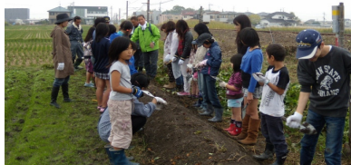
菜の花移植・芋掘り in 北永井 F