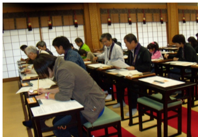
薬師寺にて写経・伽藍めぐり体験