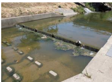
ごみがたまっている岡崎川 (H30.5 撮影)