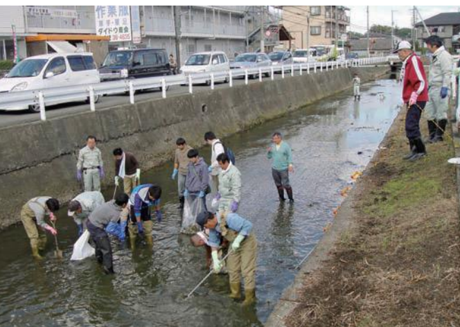
協力し合って作業をする事で 美しい環境づくりへの意識がひとつになります。

「まだ、川がきれいになったとは言えませんし、3.8kmの川ですからやることもたくさんあります。でも目に見えて変わったのは粗大ごみがなくなりました。今まで川をごみ箱のように思っている人もいましたから自転車なども平気で捨てられていました。そんなごみがなくなったのも活動の効果だと思えます。また川に鯉がいる話をしましたが、夏になると親子で鯉つりをする姿も見られます。」