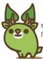
奈良県エコキャラクター 「な～らちゃん」

発行 奈良県くらし創造部 景観・環境局 環境政策課 〒630-8501 奈良市登大路町 30 TEL：0742-27-8732 FAX：0742-22-1668