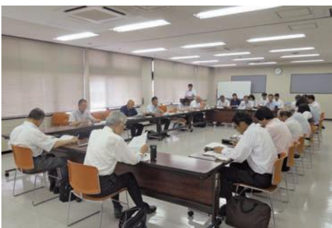
大和川重点対策支川部会 (H30.7)

課題の抽出や取組の検討を進め、水質改善・きれいな水辺空間づくりの実践活動の誘発・促進を進めてまいります。