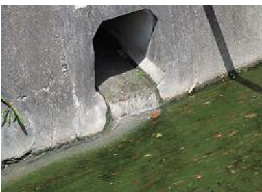
生活排水が流れ込む三代川 (H30.5 撮影)