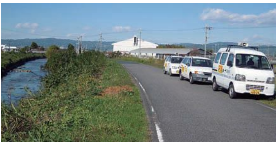
年1回、5市町村が集まり飛鳥川流域河川をパトロール。 不法投棄ゼロを目指します。