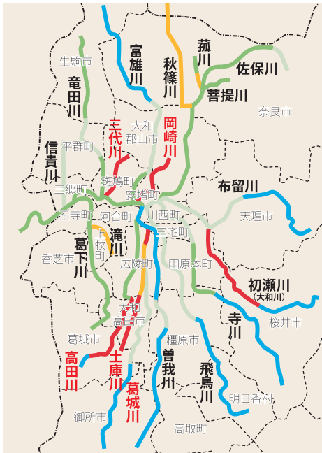
汚れている ← → きれい

るため、流域の自治体である大和高田市・広陵町と連携・協働しながら、下水道の接続状況や浄化槽の利用状況等についてデータ分析を行いました。その結果、それぞれの川の流域において人口の約40〜60%が単独浄化槽やくみ取り便所(※これらの世帯からの生活排水はそのまま川に流れ込む)を利用しており、県全体値の17%を大きく上回っていました。 このことから、下水道への早期接続、浄化槽の適正な維持管理や川を汚さない生活スタイルについて、より一層促進していく必要があります。