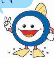
下水道マスコットキャラクター 「スイスイ」