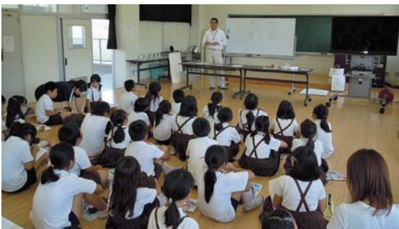
小学校を訪問して水と暮らしの関わりを伝える「出前授業」は、 人気事業のひとつです。

今後は日本一の清流を目指したいと考えている そうです。そのためには、水に対する個々の意識 こそ大切で、一人一人が水の使い方など日々の生 活を見直せば、さらにきれいな飛鳥川になってい くと本推進会議は考えているそうです。子どもた ちが環境について学べる機会も増えているので、 これからの10年、20年に期待が持て、楽しみでも あるとのこと。