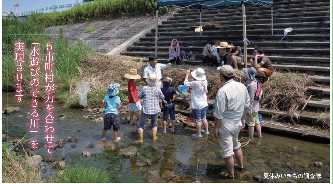
夏休みいきもの調査隊