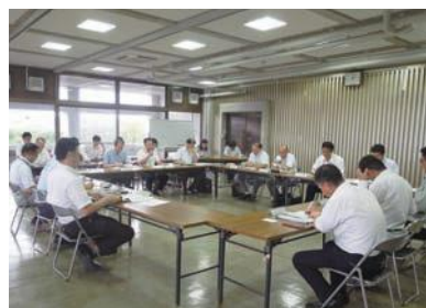
県・市町担当課長会議 (H30.7)