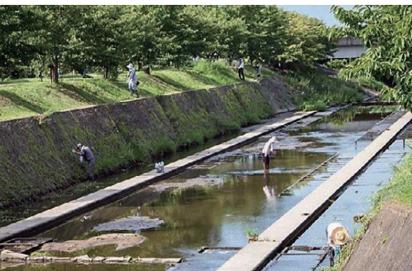
定期的な草刈りや清掃活動により、岡崎川を守っています。