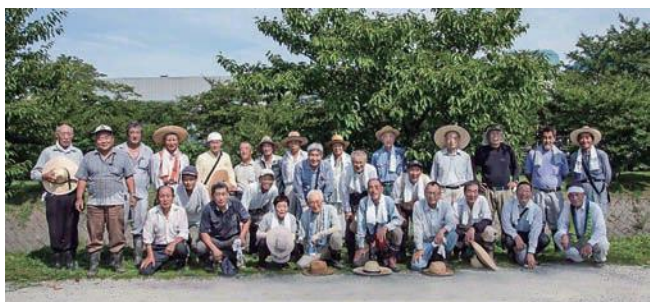
安堵桜遊会のメンバー きれいな川、美しい町づくりを目指し活動しています。