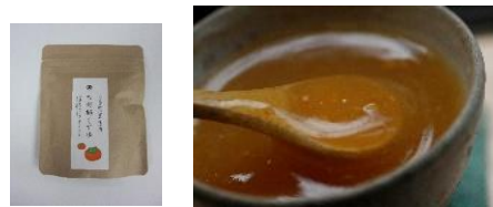
(株)吉田屋[下市町] くずゆ