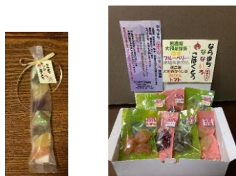
ならまち招福庵[奈良市] ならまち庚申さんなないろこはくとう