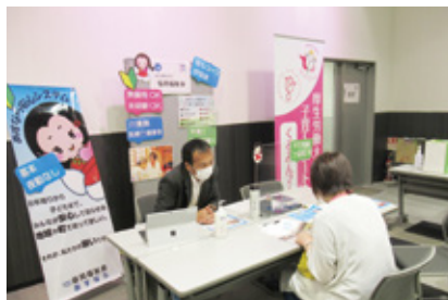
女性のための再就職応援フェスタ