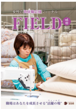
女性の再就職応援ジャーナル「FIELD」

「あまり知られていない良い企業」がたくさんある奈良。知られざる県内企業・事業所の魅力を発信しています。