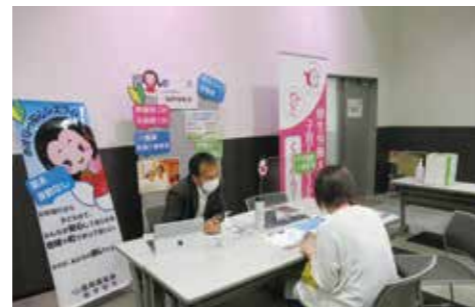
個別のブースで企業と女性が交流