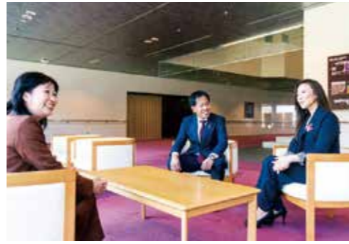
ジャーナル対談の様子