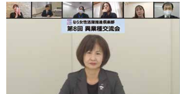
②第8回オンラインセミナーの様子(PC画面)