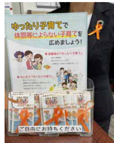
三井住友信託銀行(株)：窓口

今年度初めて、倶楽部統一取組として11月の「児童虐待防止月間」(オレンジリボンキャンペーン)、11月12日～25日の「女性に対する暴力をなくす運動」(パープルリボンキャンペーン)の啓発活動について、13の会員企業がその企業内外において独自の取組を実施しました。