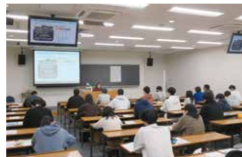
熱心に講義を聴く学生