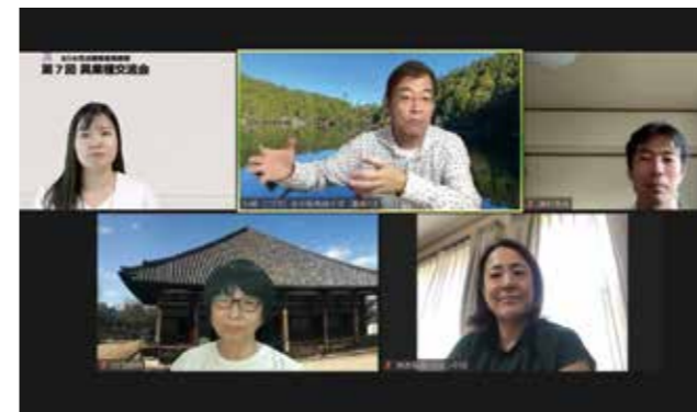
①第7回オンラインセミナーの様子(PC画面)

【参加者より】「D&Iに理解を得られない上司への対し方」など具体的な取組事例が参考になりました！