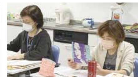
市民生活協同組合ならコープ：社内研修