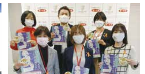
第一生命保険(株)：出陣会