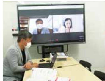
テレワークでの会議の様子

あまり知られていない県内企業、事業所の魅力を発信し、企業での取組を推進するためメディアを通じて積極的に発信しています。「男性育休」「テレワーク転勤」など、企業独自の取組を取材しました。