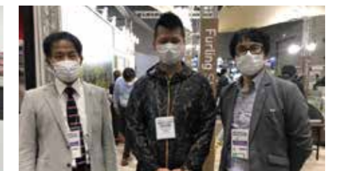
(株)池田工業社：展示会